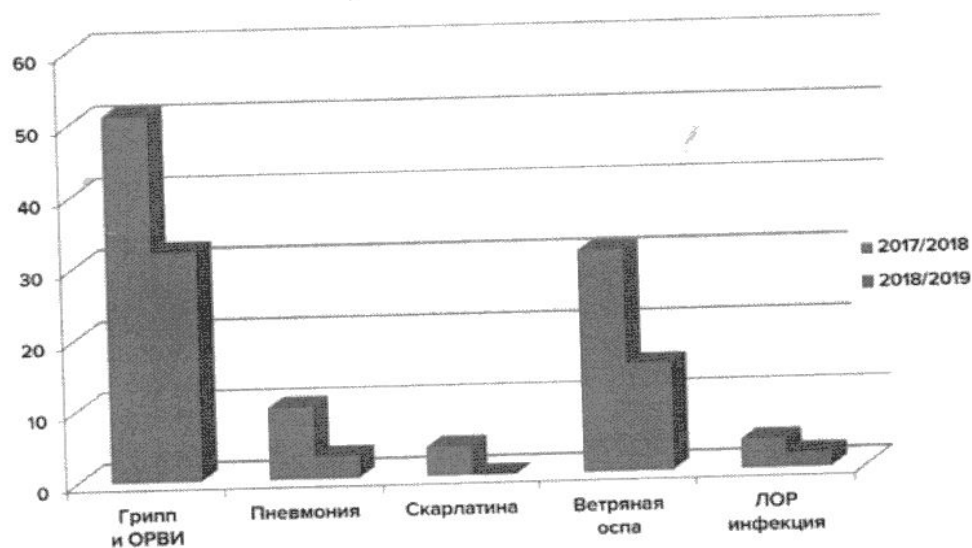
Рисунок 1 - Заболеваемость воспитанников в сравнении с предыдущим годом